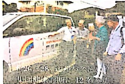
6/26・28：送迎バスに乗り 集団健康診断に12名参加