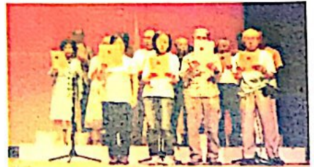
6/22：栄公会堂で開催の「歌声 広場」に参加し、大きな声で32 曲楽しく歌って来ました