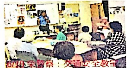
6/19：奉賛祭：交通安全教室